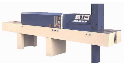
Fours électriques à tapis transporteur sous atmosphère de protection Conveyor belt electric furnaces with controlled atmosphere