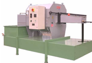
Fours à pelle basculante - EASYSTAMP 335 - avec bac de trempe eau EASYSTAMP 335 furnaces - with tilting shovel and water quenching tank

Toutes ces données techniques sont susceptibles d'être modifiées sans préavis. Liste de références sur demande. Devis sans engagement.