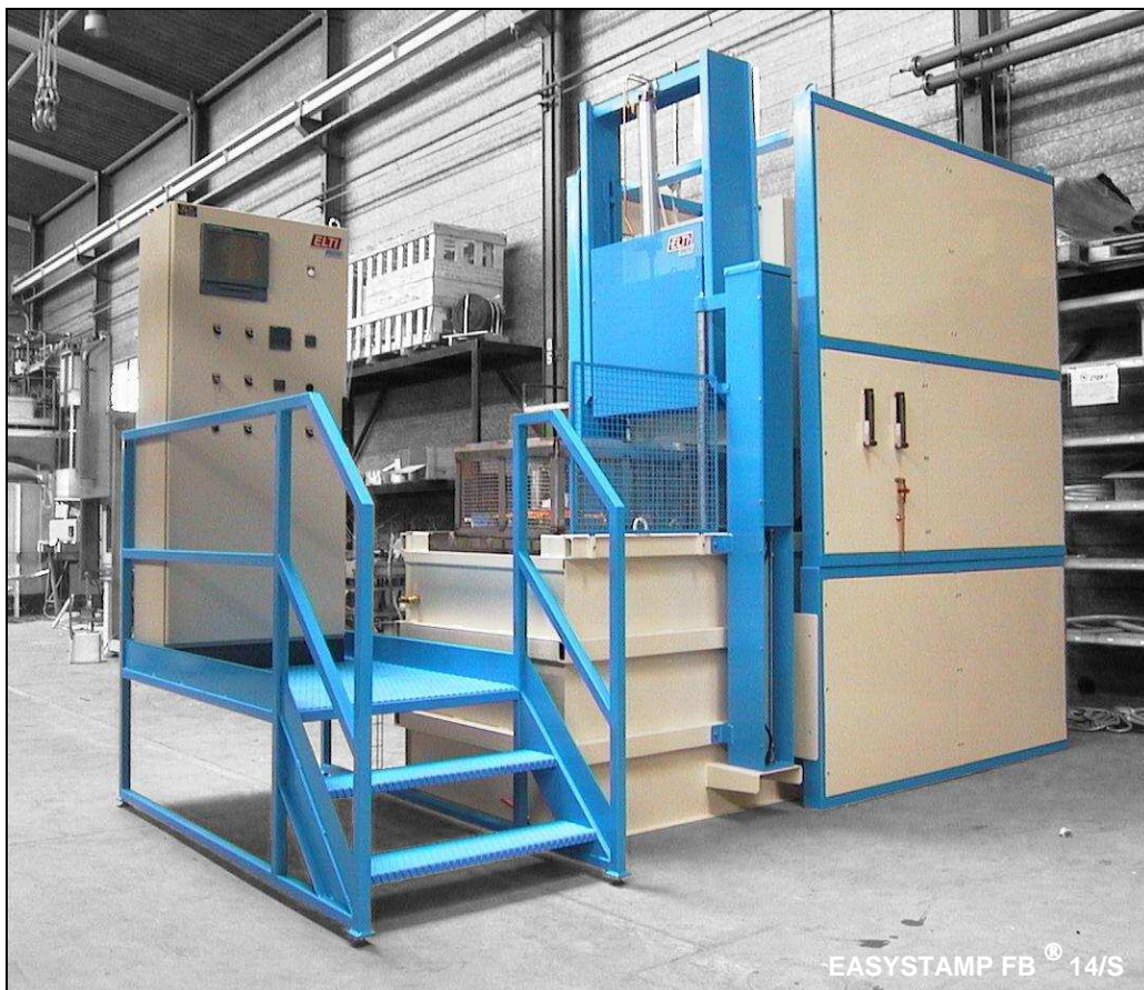
EASYSTAMP FB ® 14/S