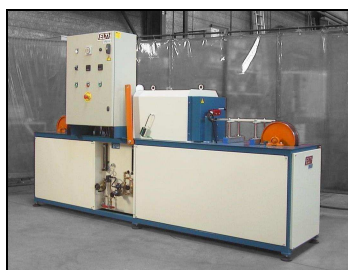
Four à tapis modèle EASYGOLD 331

Conveyor belt furnace model EASYGOLD 331