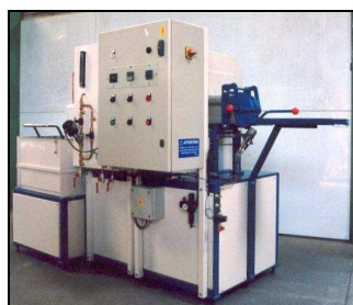
Four à pelle basculante Easystamp 337 avec bac de trempe eau

Conveyor belt furnace model EASYGOLD 331